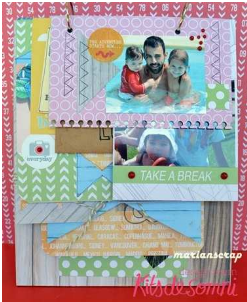
Página de 15 x 9 con un troquel en el extremo!!!