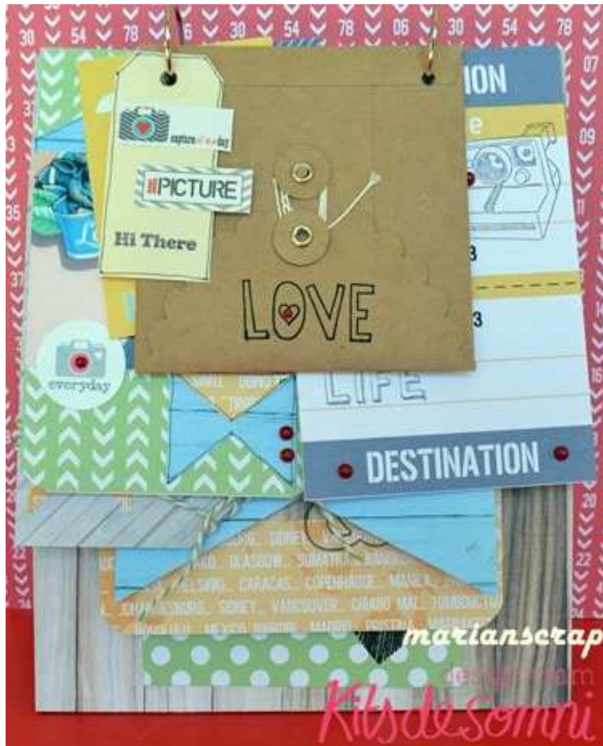
Uno de los tags y un sobre con sello.