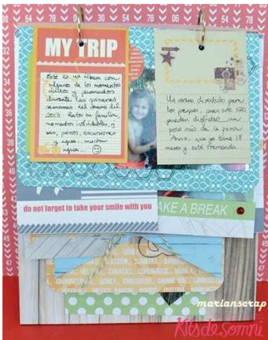
En la primera página dos de las tarjetitas pequeñas para journaling!!