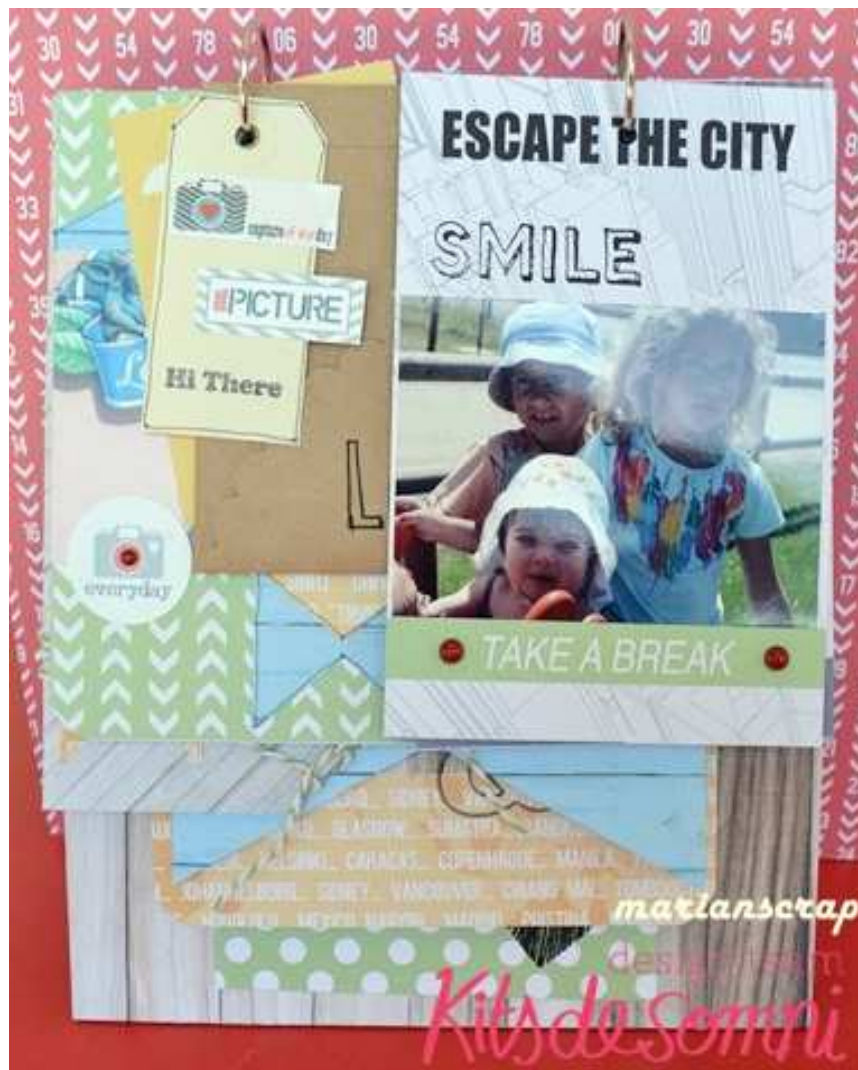
Una de las tarjetas con foto.