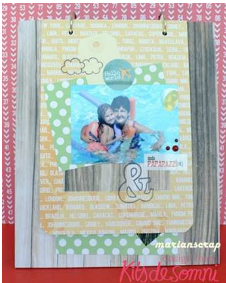
Página de 14 x 20 con los extremos redondeados.