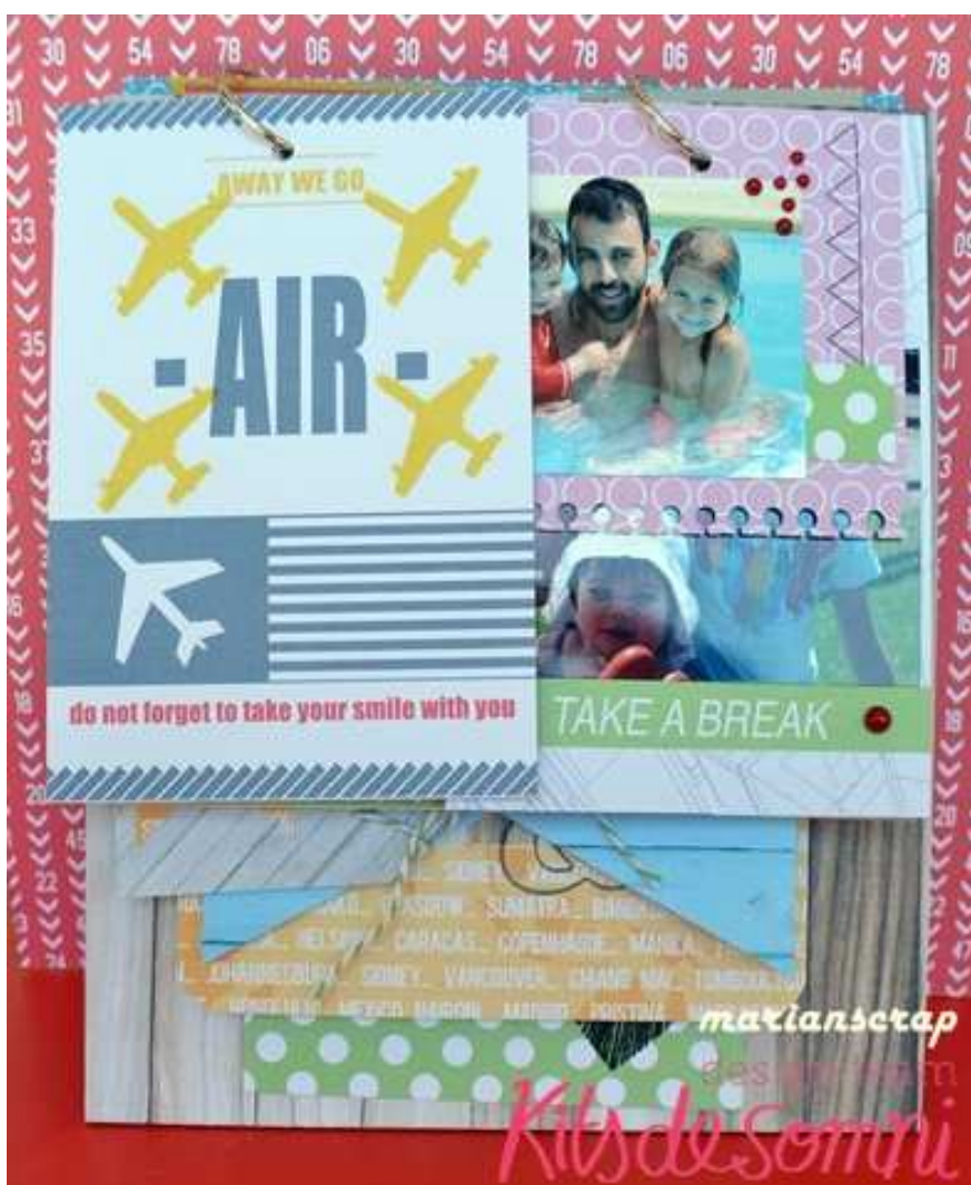
Una de las tarjetas con sellos.